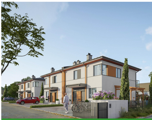
KARTA LOKALU I.B.2